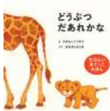
『どうぶつだあれかな』 かきもこうぞう/絵 はせがわさとみ/文 学研プラスより