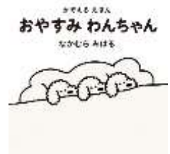
『かぞえるえほん おやすみわんちゃん』 なかむらみはる/作 偕成社より

ねんねの じかん。おふとんの なかの わんちゃんが ふえていくよ。じゅんばんに かぞえて、1わんこ 2わんこ…。 (由)