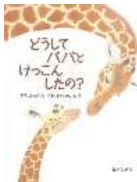
『どうしてパパと けっこんしたの？ どうぶつたち それぞれのこたえ』 桃戸栗子/作 福音館書店より

どうぶつの メスは、オスの どんなところに ひかれて けっこんするのでしょうか？ こどもから しつもんを うけた、 ペンギンやライオンの ママたちが、ユーモアを ま じえて パパを えらんだ りゆうを おしえてくれます。 (由)