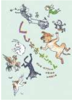
『くしゃみおじさん』 オルガ・カブラル/作 小宮由/訳 山村浩二/絵 岩波書店より