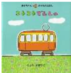
『コトコトでんしゃ』 とよたかずひこ/著 アリス館より