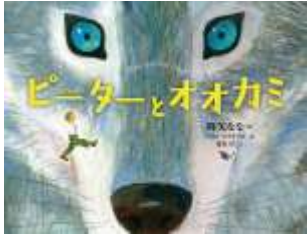
『ピーターとオオカミ』 セルゲイ・プロコフィエフ/作 森安淳/文 降矢なな/絵 ペテル・ウフナール/絵 偕成社より