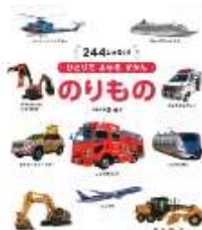
『244しゅるい! のりもの』 海老原美宜男(監修) 瀧靖之(監修) 学研プラスより

ちいさい こどもむけの コ ンパクトな のりもの ずか んです。もくじには、ちいさ な しゃしんつきで、れっし ゃ、くるま、ひこうき、ふね、 あわせて 244 しゅるいが のっています。ページ ばん ごうを みれば、さがしてい る のりものが すぐに み つかるので、とても べんり です。(由)