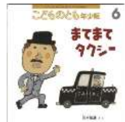
『まてまてタクシー』 西村敏雄/さく 福音館書店より

ハットさんは、タクシーに わすれものを してしまいました。さあ、たいへん! あわてて おいかけますが…。(由)