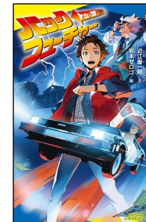
『バック・トゥ・ザ・フューチャー』 ロバート・ゼメキス/監督 おうみや いちろう 近江屋 一朗/文 岩本 ゼロゴ/絵 ポプラ社

マーティーが過去に来た影響で変わっていく未来。マー ティーは無事未来に帰ることができるのか。 王道SFの作品を小説化したお話です。