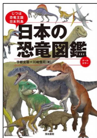
『日本の恐竜図鑑』 うつのみや さとし 宇都宮 聡/著 かわさき さとし 川崎 悟司/著 築地書館