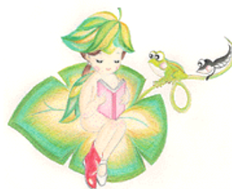
蓮田市図書館キャラクター 「夢話ちゃん」