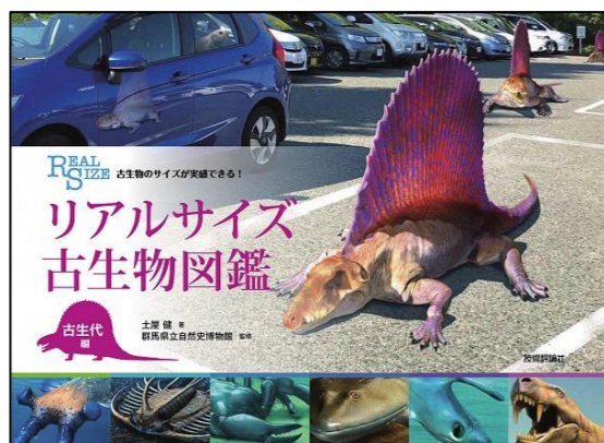
『リアルサイズ古生物図鑑 古生代編』 つちや けん 土屋 健/著 群馬県立自然史博物館/監修 技術評論社