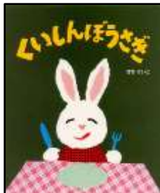
『くいしんぼうさぎ』 せなけいこ/作・絵 ポプラ社より