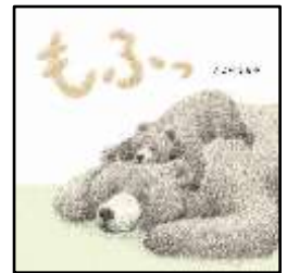
『もふっ』 ふじいともみ/作 アリス館より