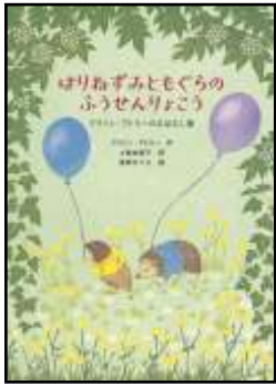
『はりねずみともぐらの ふうせんりょこう』 アリソン・アトリー/作 上條由美子/訳 東郷なりさ/絵 福音館書店より