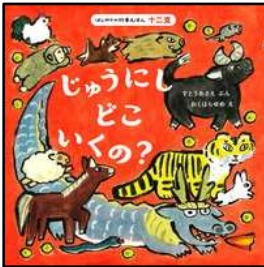
『じゅうにしどこいくの?』 すとうあさえ/ぶん おくはらゆめ/え ほるぷ出版より