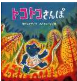
『トコトコさんぽ』 長野ヒデ子/作 スズキコージ/絵 鈴木出版より

くまさんの さんぽは いそがしい。ふうせんが とんでくれば、つかんで てにもつし、めがねが おちていれば、めがねを かけるし、ぼうしを みつければ、ぼうしを かぶる。そんな ひろいもので からだじゅう いっぱいだけど、リズムに のって ゆかいな さんぽは つづく…。(由)