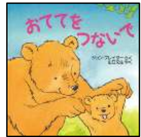
『おててをつないで』 ジョン・プレイター/さく 山口文生/やく 評論社より