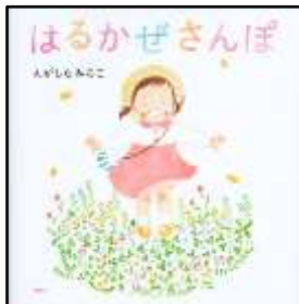
『はるかぜさんぽ』 えがしらみちこ/作 講談社より