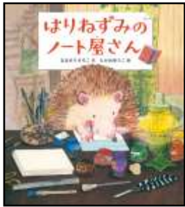
『はりねずみのノート屋さん』 ななもりさちこ/作 たかおゆうこ/絵 福音館書店より