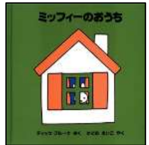
『ミッフィーのおうち』 ディック=ブルーナ/さく かどのえいこ/やく 講談社より Illustrations Dick Bruna

ミッフィーの おうちには、ミッフィーの カップや、あたらしい ブーツが あって、 へやの すみの おもちやばこには…。(由)