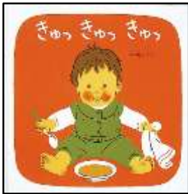
『きゅっきゅっきゅつ』 林明子/さく 福音館書店より