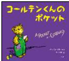
『コールテンくんの ポケット』 ドン・フリーマン/作 木坂涼/訳 好学社より

あるひ、リサと いっしょ に ランドリーへ いった くまの コールテンくん。リ サが、おかあさんの てつ だいを している あいだ しずかに まっていました が、「ポケット」という こ とばが みみにはいると、 じぶんの ズボンに ポケ ットが ないことに きが ついて…。(由)