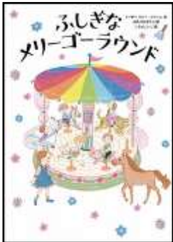
『ふしぎなメリーゴーラウンド』 リーザ＝マリー・ブルーム/作 はたさわゆうこ/訳 こやまこいこ/絵 徳間書店より