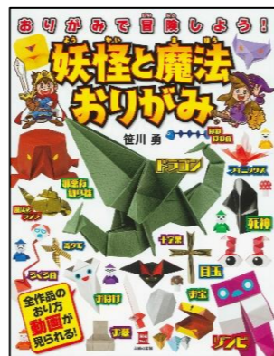
『妖怪と魔法おりがみ』 笹川 勇／著 ヨシムラヨシユキ／イラスト 主婦の友社