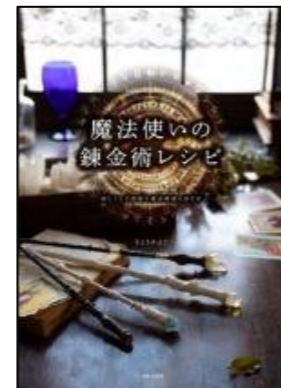
『魔法使いの錬金術レシピ』 さとう かよこ／著 天野 恵仁／撮影 日本文芸社