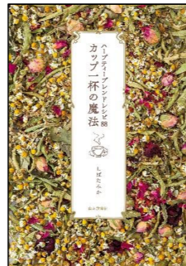
『カップ一杯の魔法』 しばた みか／著 ハギーK／イラスト 山と溪谷社