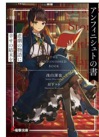
『アンフィニシュトの書』 あさしろ しんや 浅白 深也/著 くさか 日下 コウ/イラスト KADOKAWA 電撃文庫