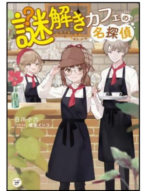
『謎解きカフェの名探偵』 しらかわ ころく 白川 小六／著 ぼりいすみ 堀泉 インコ／イラスト KADOKAWA

作中の謎解きが進んでいく中で、アイは微かな違和感を感じていきます。その違和感の答えとは一体…?