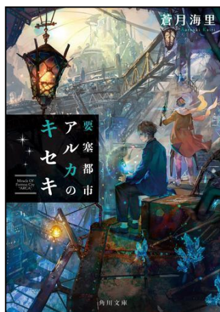
『要塞都市アルカのキセキ』 あおつき かいり 蒼月 海里/著 むなしち 六七質/イラスト KADOKAWA 角川文庫

あおつき かいり むなしち 蒼月 海里/著 六七質/カバーイラスト KADOKAWA 角川文庫