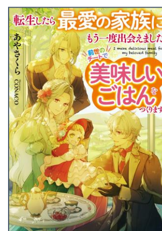
『転生したら最愛の家族にもう一度出会えました 前世のチートで美味しいごはんをつくります』 あや さくら/著 CONACO/イラストレーター アース・スター エンターテイメント

あや さくら/著 CONACO/イラストレーター アース・スター エンターテイメント