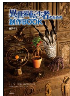
『異世界転生者のための創作BOOK』 倉戸 みと／著 寺岡 みゆき／口絵・カバー撮影 日本文芸社