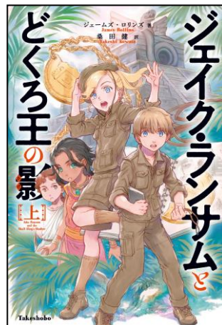
『ジェイク・ランサムとどくろ王の影 上』 ジェームズ・ロリンズ/著 くわた たけし 桑田 健/訳 いわさき みなこ 岩崎 美奈子/イラスト 竹書房

今回のテーマは「別世界」。今流行りの転生モノや、異世界転移など様々な世界を集めてみました。本を通じて、たくさんのお楽しみください。