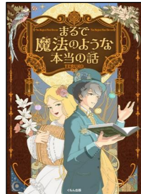
『まるで魔法のような本当の話』 TERUKO／著 くもん出版