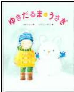
『ゆきだるまうさぎ』 田中てるみ/文 えがしらみちこ/絵 BL 出版より