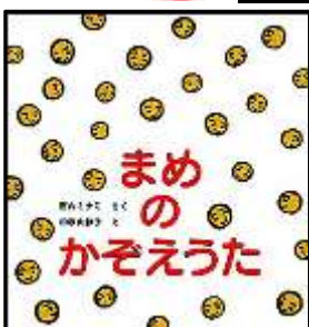
『まめのかぞえうた』 西内ミナミ/さく 和歌山静子/え 鈴木出版より