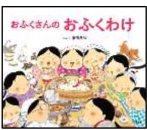
『おふくさんのおふくわけ』 服部美法/ぶん・え 大日本図書より

10にんの おふくさんたちが あつまって、にぎやかに ごはんを たべていると、「おれにも くわせろ！」と、とつぜん おにが やってきました。でも、おにの ぶんは、もうのこって いません。あるのは、まめと おいもだけ。そこで、おふくさんたちは…。(由)