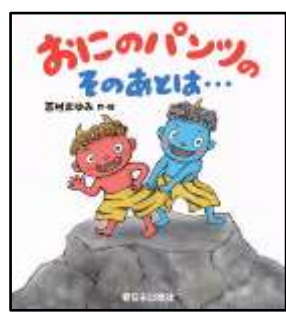
『おにのパンツのそのあとは…』 志村まゆみ/作・絵 新日本出版社より

志村まゆみ/作・絵 新日本出版社 <E シ オレンジ> ♪おにの パンツは いい パンツ 5ねん はいても やぶれない♪ そのわけは…。(由)